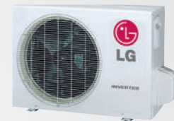
E09EL.UA3 / E12EL.UA3