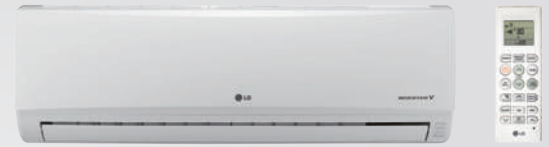
E09EL.NSH / E12EL.NSH